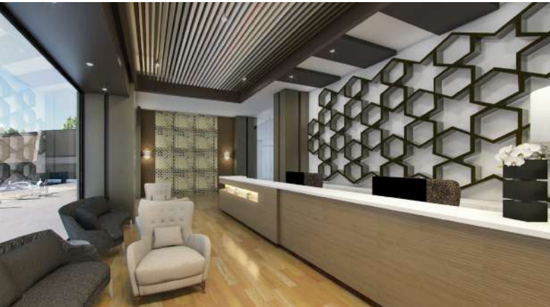
Centralized residential lobby with reception per tower 集中式公寓大堂，每个塔楼都有接待处和单独的休息区