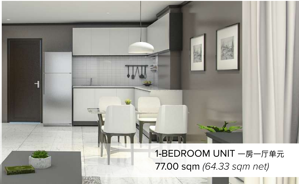
1-BEDROOM UNIT 一房一厅单元 77.00 sqm (64.33 sqm net)