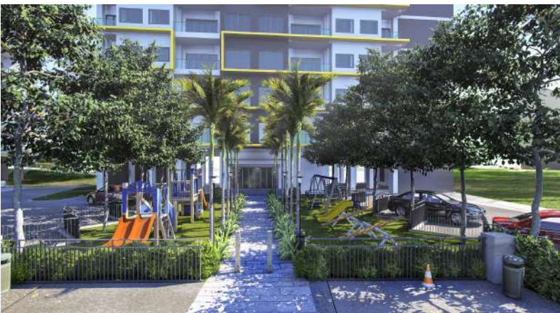
Children's Outdoor Playground 儿童游乐场