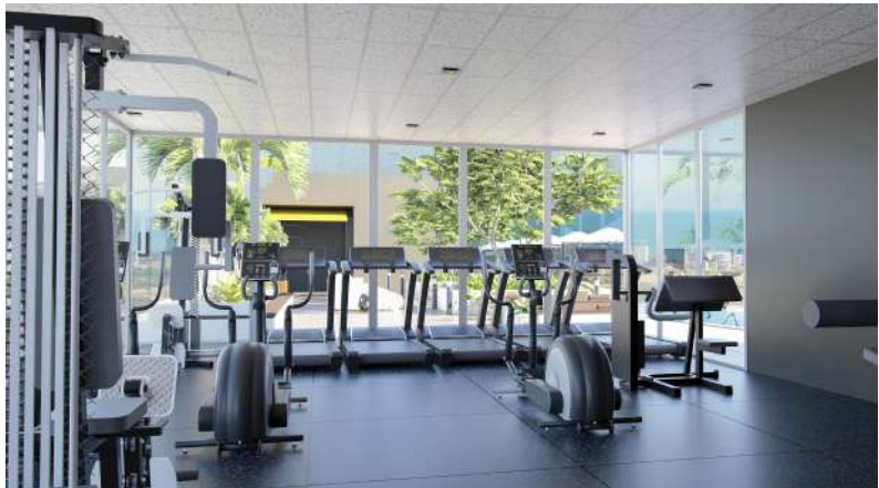
Fitness Center 健身中心